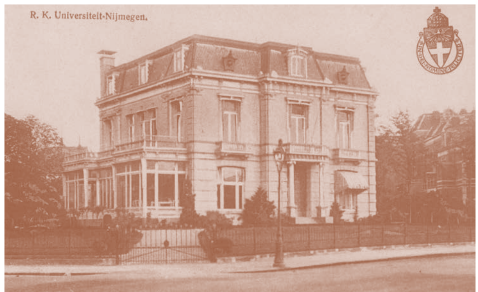
Het gebouw van de RK Universiteit te Nijmegen bij de opening in juni 1923.

Op de permanente tentoonstelling over het leven en werk van pater Titus in het in 2003 geopende Titus Brandsma Mu-