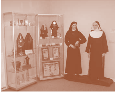
Tijdens de "Open dagen" is ook de expositieruimte geopend