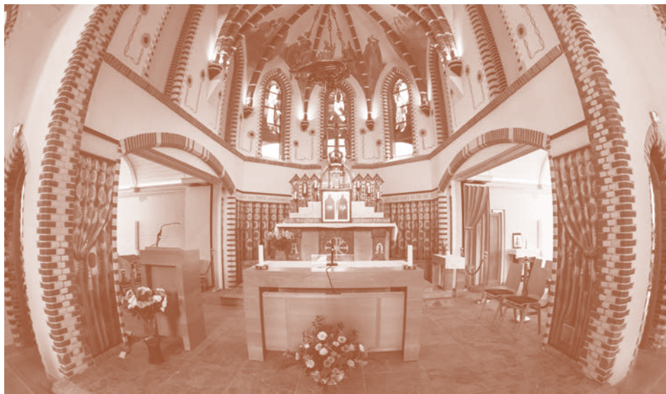
Het vernieuwde priesterkoor in de H. Clemenskerk te Nes op Ameland in 2017.